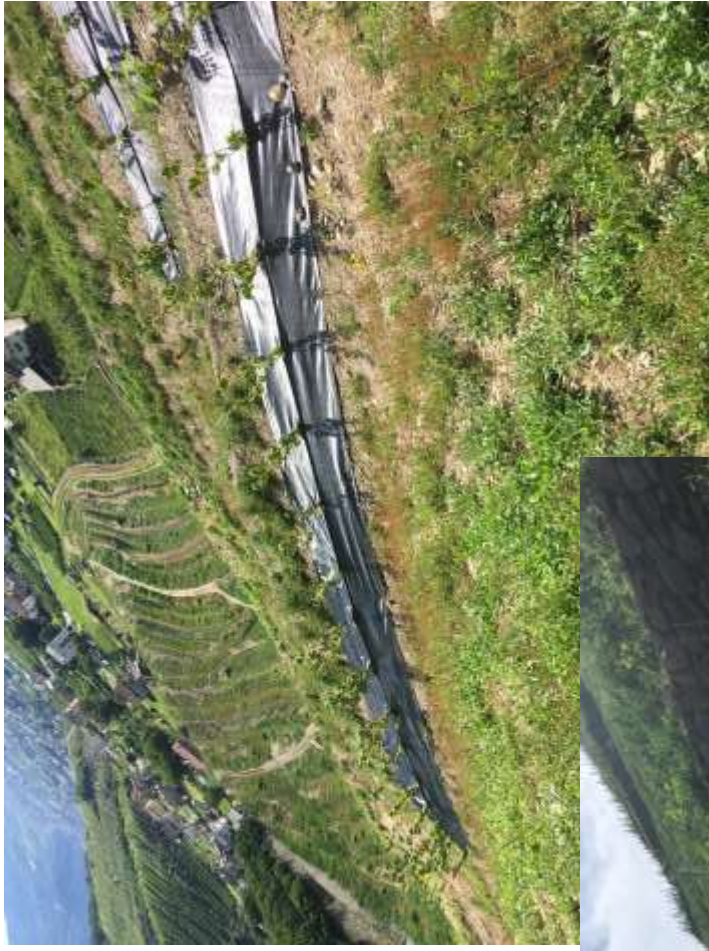
Ribes nero completo di ala gocciolante singola e pacciamatura.