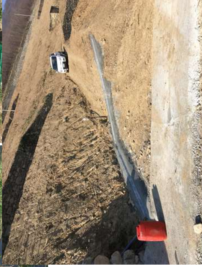
Canaletta convogliamento acque piovane con correnti guard rail e selciato in calcestruzzo.