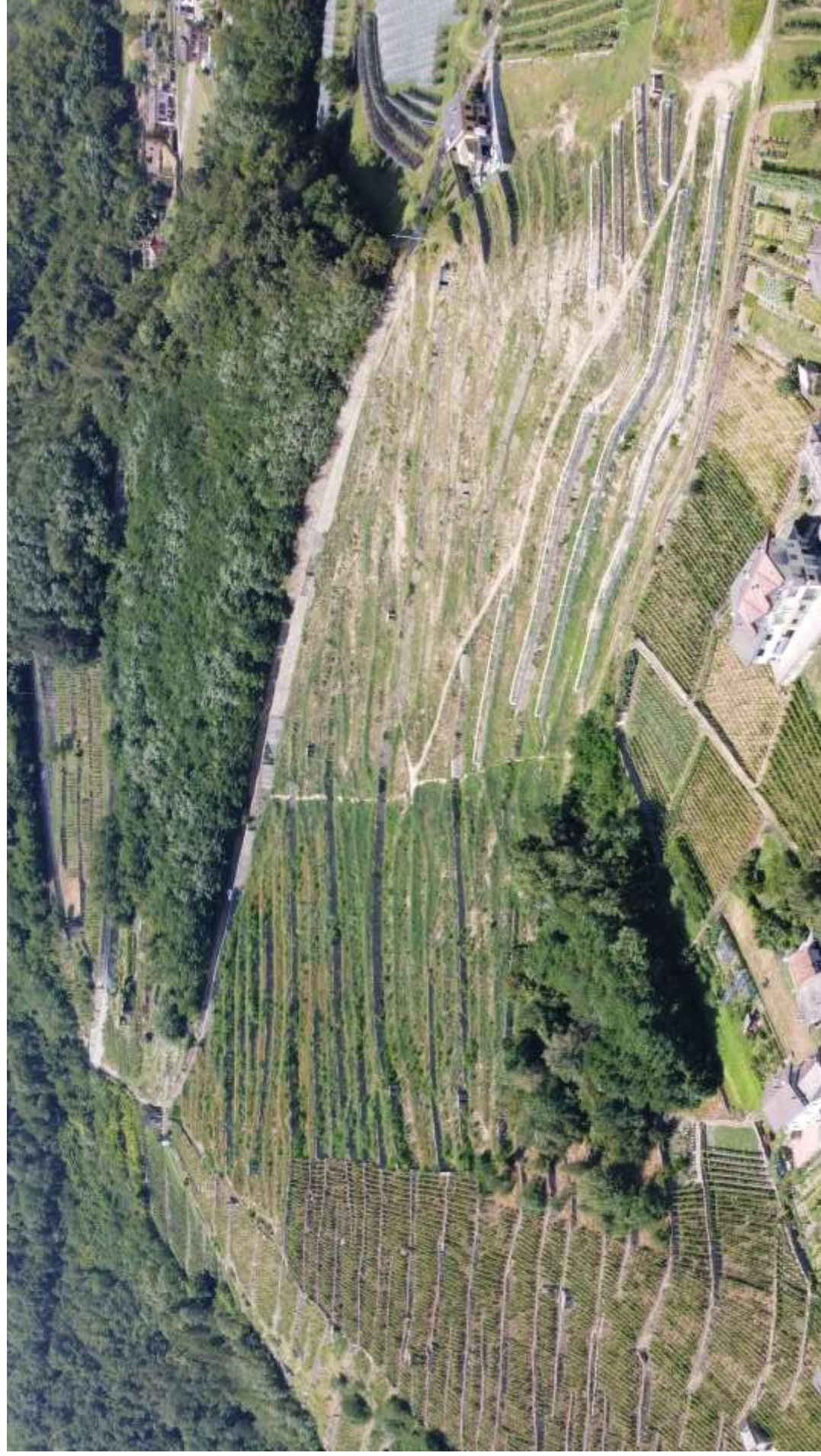
Ripresa generale da Sud Est.