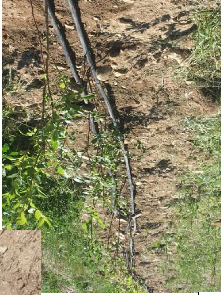
Doppia ala gocciolante per mirtillo