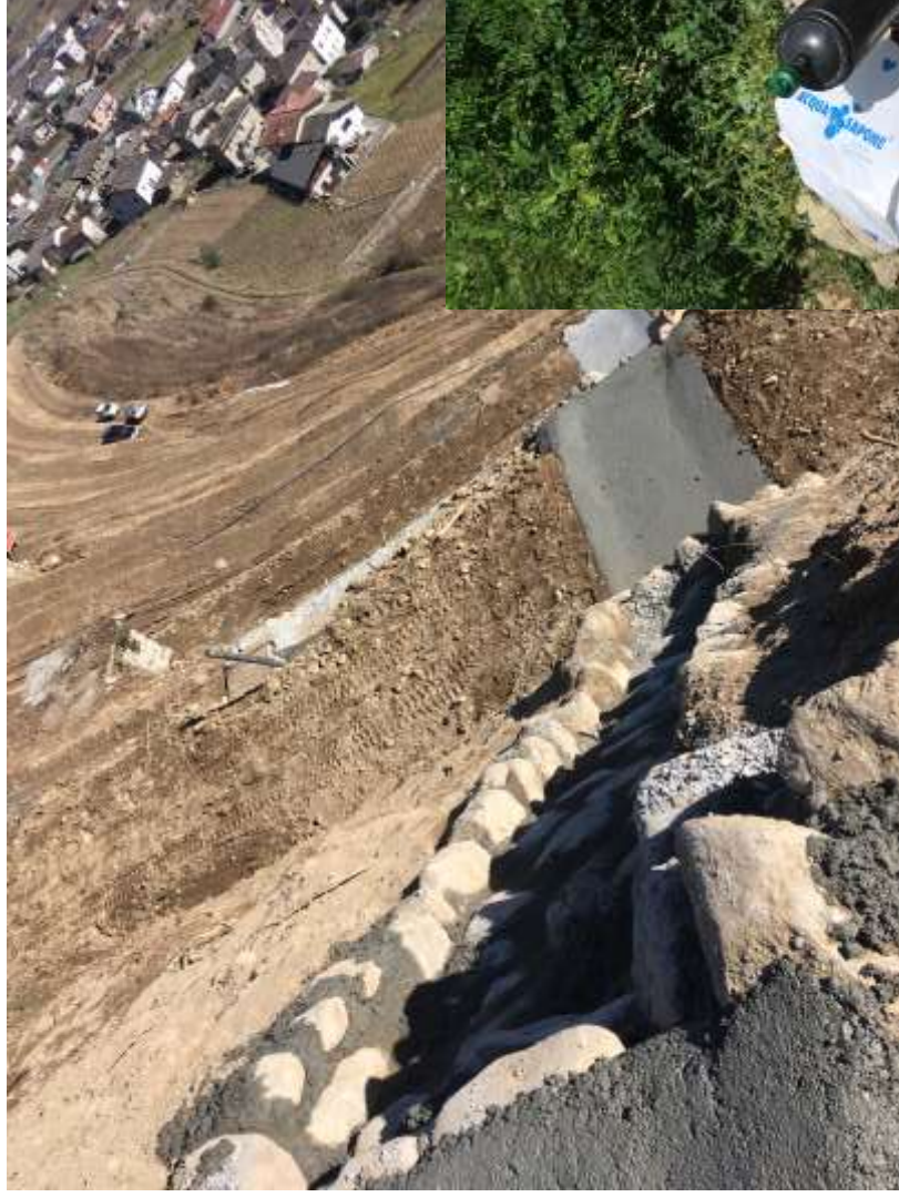
Ricostruzione canale in pietrame e calcestruzzo con relative soglie di attraversamento della viabilità.