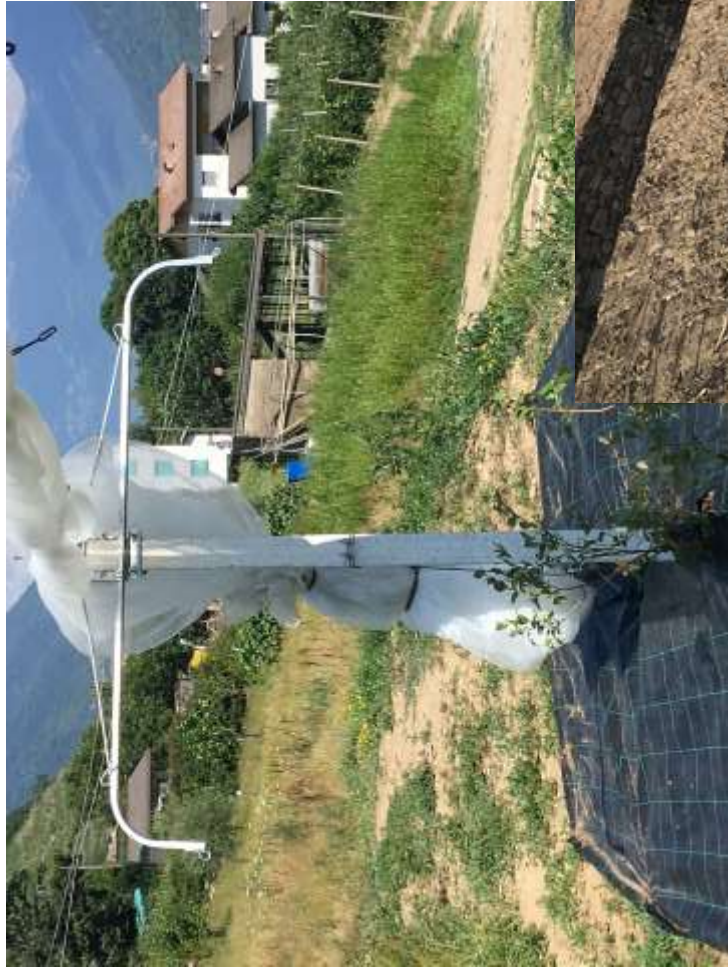
Sostegno per mirtillo tardivo completo di telo anti insetto e pacciamatura.