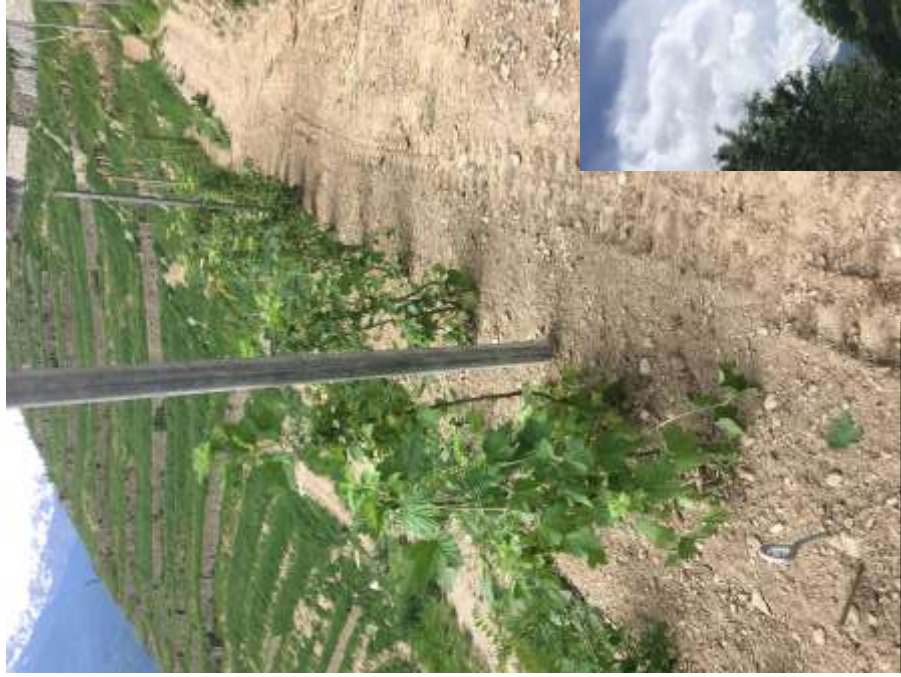
Ribes rosso con sostegni