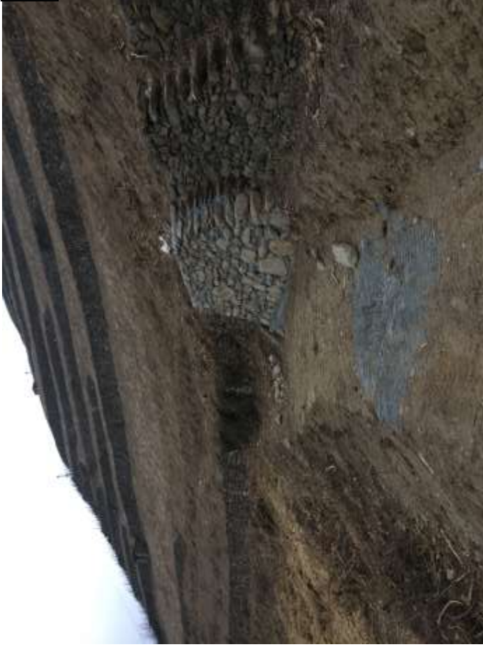
Particolare ricostruzione muri di sostegno