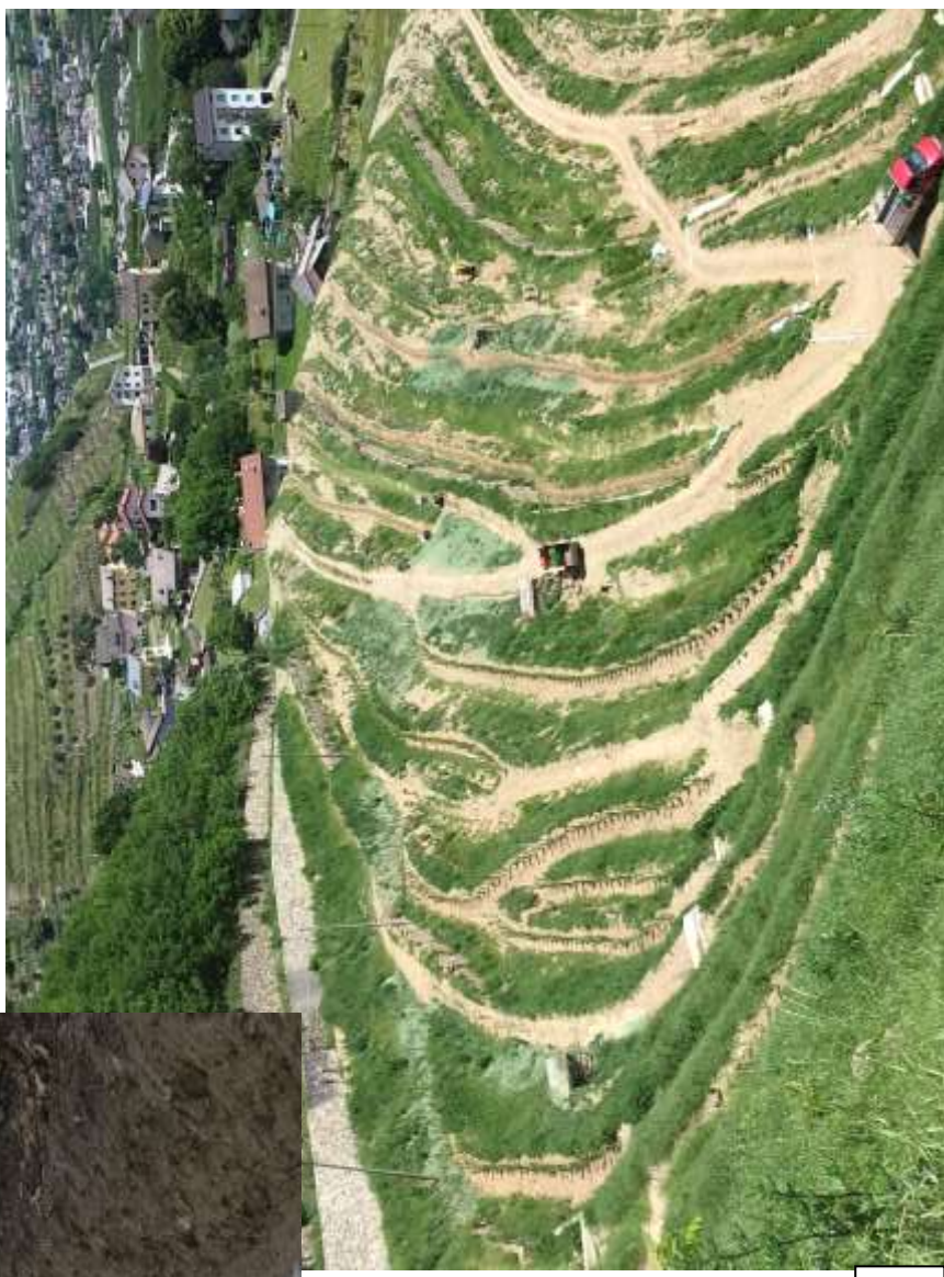
Particolare idro semina potenziata