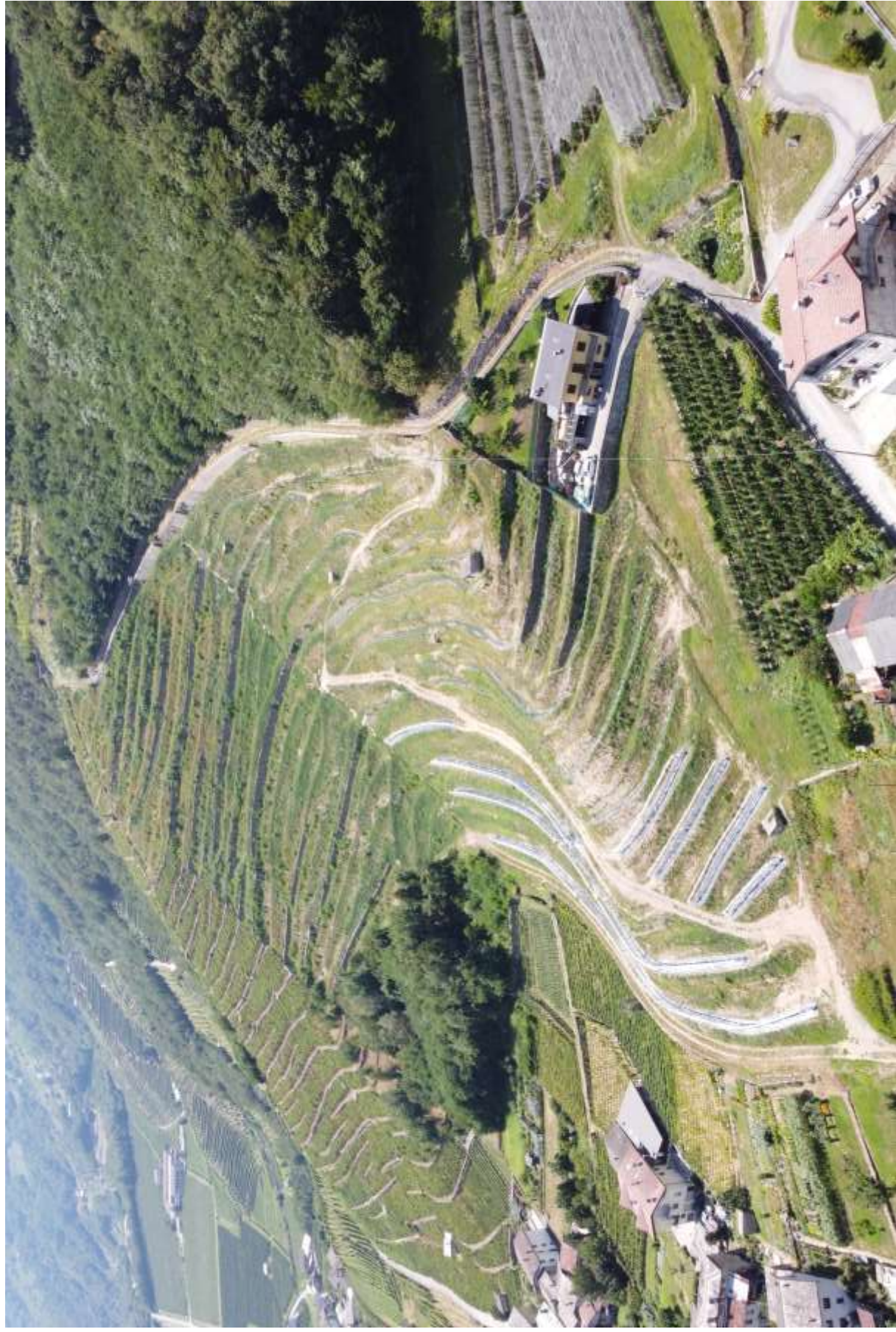
Ripresa da Nord Est.