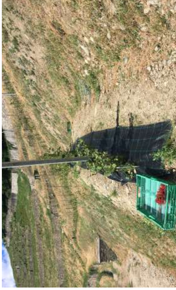
Particolare impianto ribes rosso con sostegni e pacciamatura