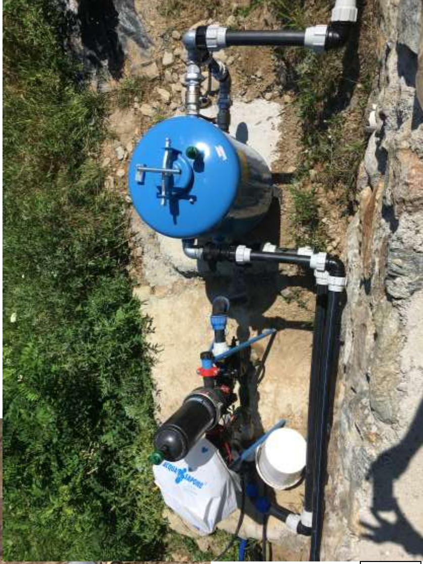
Particolare gruppo di filtraggio. A destra filtro a graniglia e a sinistra filtro a dischi automatizzato.